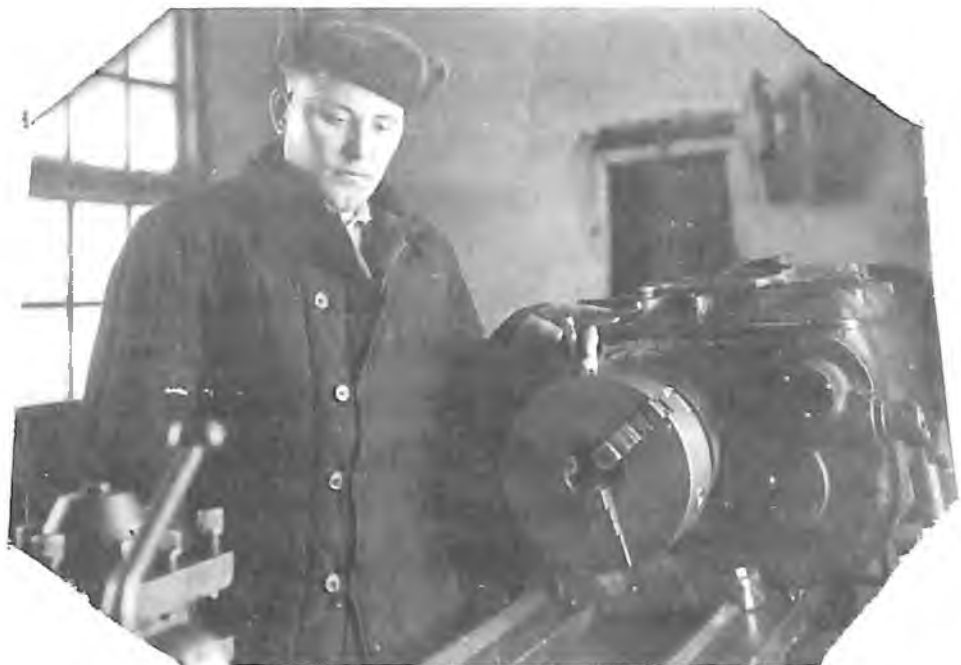
Отец у токарного станка