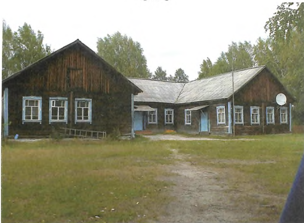
Здание школы посёлка Первомайский, в которой Вера училась с 1963 по 1969 гг.